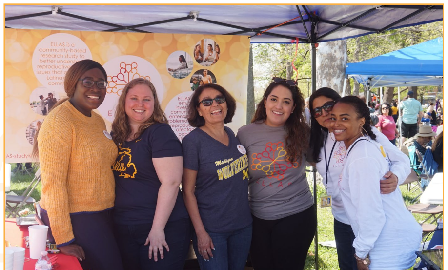
El equipo de ELLAS celebra Cinco de Mayo en Clark Park