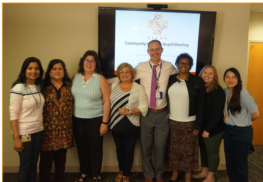
El equipo ELLAS y los miembros de CAB, junio de 2019