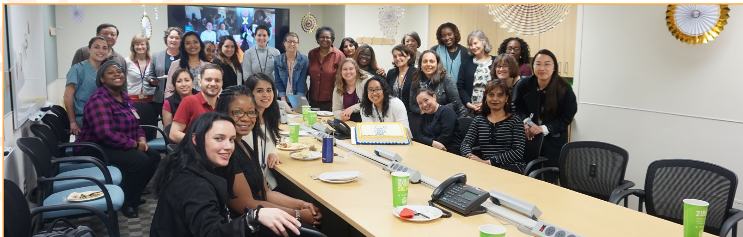
El equipo ELLAS celebra la inscripción de 300 participantes en el estudio