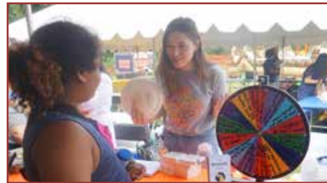
El equipo de ELLAS está dando a conocer información acerca de nuestro estudio en varios eventos comunitarios en otoño.